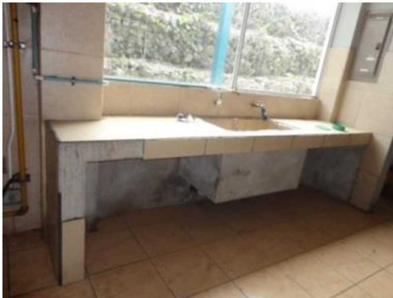
Mueble de la Pila