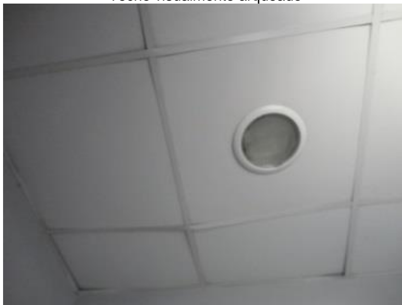
Techo visualmente arqueado